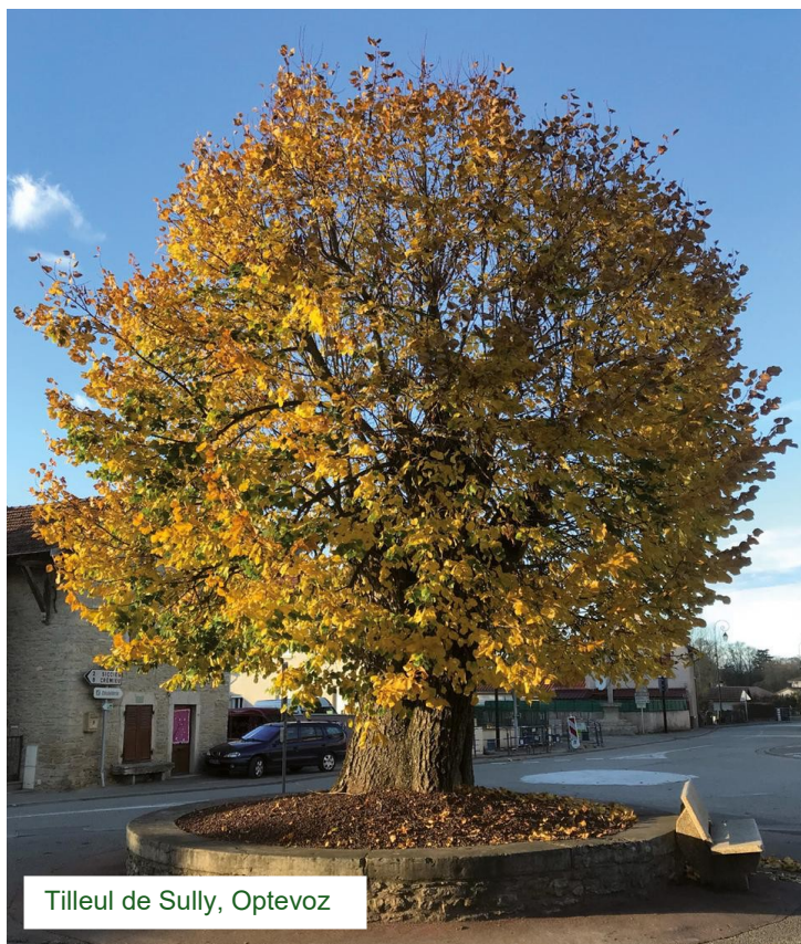
Tilleul de Sully, Optevoz