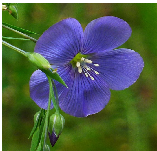
Linum austriacum – Bertrand Buis - Telabonica

Ce Lin pousse sur les coteaux pierreux secs ou dans les pelouses sèches.