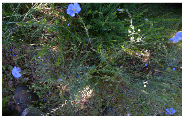
Linum austriacum – Pierrette Chamberaud