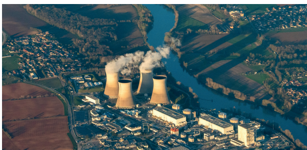
CNPE du Bugey

Le débat public portera sur les enjeux locaux et nationaux de ce projet, et sur ses impacts de toute nature sur les territoires concernés.